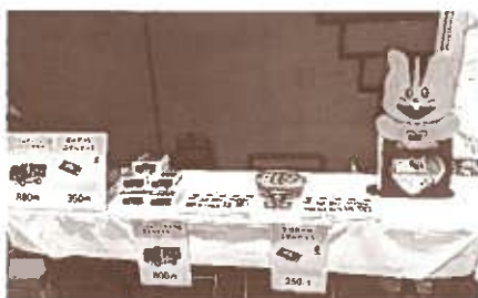
グリーンコープひろしま30周年記念グッズの販売も行いました。

8月5日(月)広島県総合体育館グリーンアリーナで行われた「2024ピースアクション in ヒロシマ」虹のひろばに参加しました。会場では、ステージ発表が行われたほか、各団体による日頃の平和についての活動を紹介するブースが設けられていました。ブースには全国の生協団体からの展示があり、お互いの取り組みを知り、交流が出来る貴重な機会となりました。グリーンコープひろしまは、昨年「心をひとつに!!ヒロシマナガサキおりづるアクション『被爆者 切明千枝子さんの被爆体験の